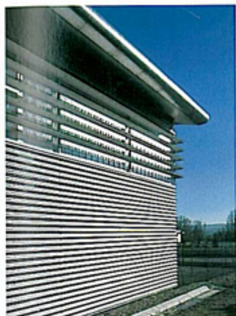
Vue sur l'angle.

Maître d'ouvrage : S.I.G. du CES de Rousset / Maître d'œuvre : Marie-France Chatenel / BET structures : Marciano / Charpente : Vinson Frères / Couverture-bardage : Solrabat / Métallerie : Charraix.