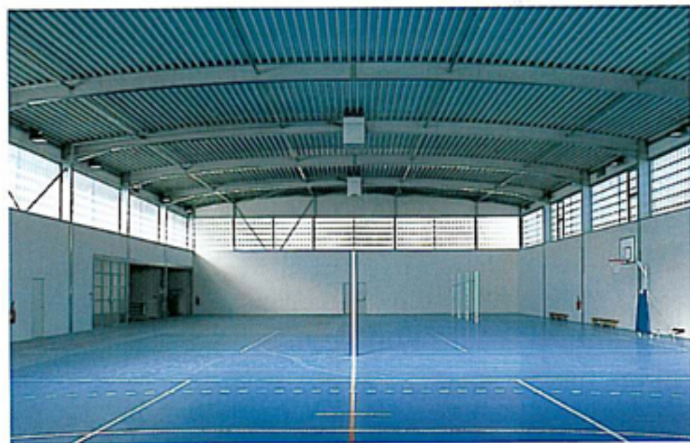
L'intérieur de la salle.